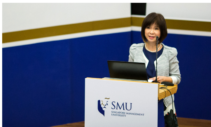
Sumber: Singapore Press Holdings Limited. Dicitak semula dengan keizinan.